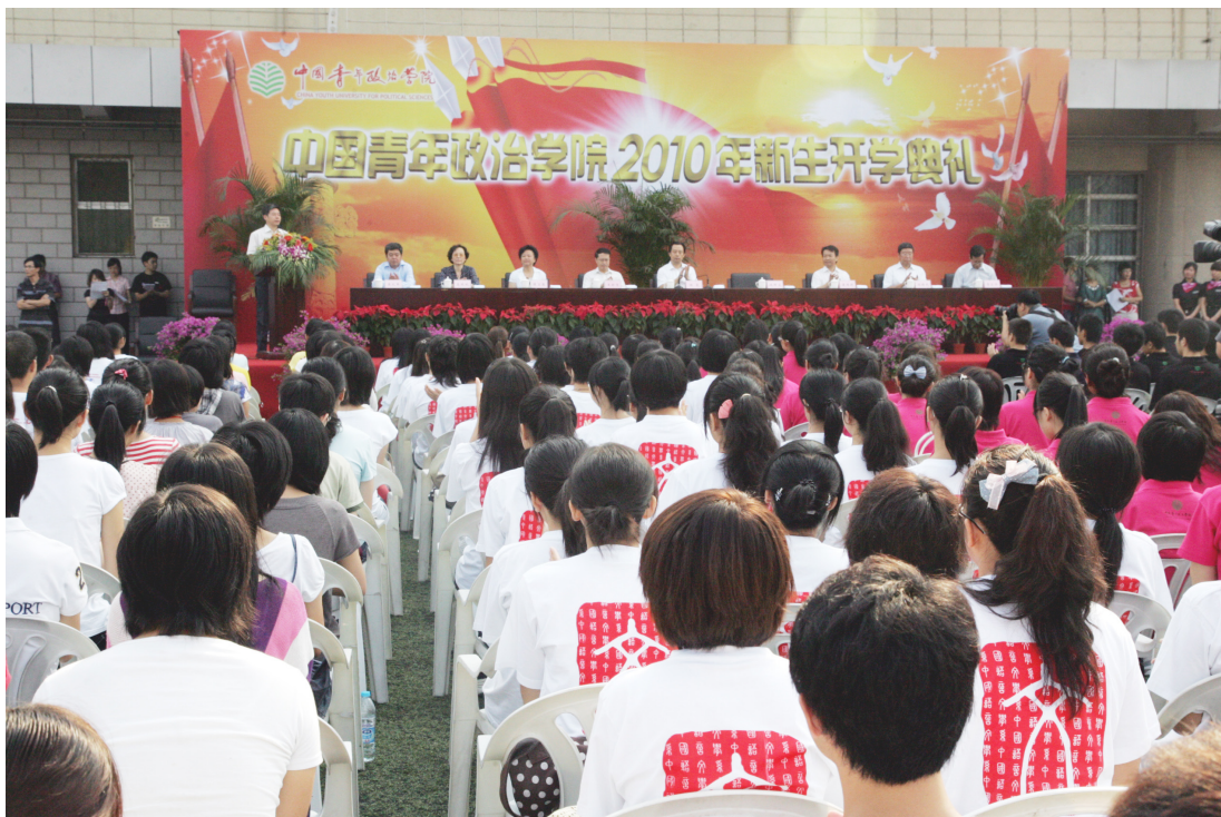
9月14日，我校举行2010级新生开学典礼。团中央书记处第一书记、中国青年政治学院院长陆昊出席典礼并发表讲话。