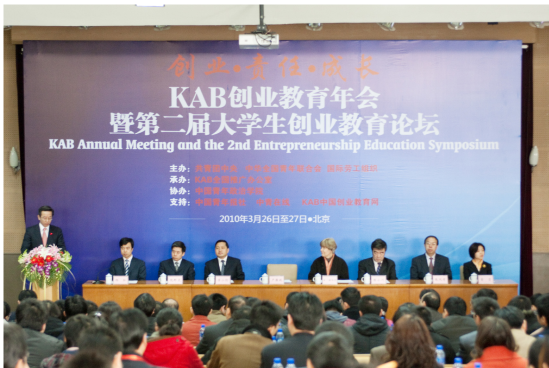
3月26日，由共青团中央、全国青联与国际劳工组织合作主办，我校协办的KAB创业教育年会暨第二届大学生创业教育论坛在我校开幕。