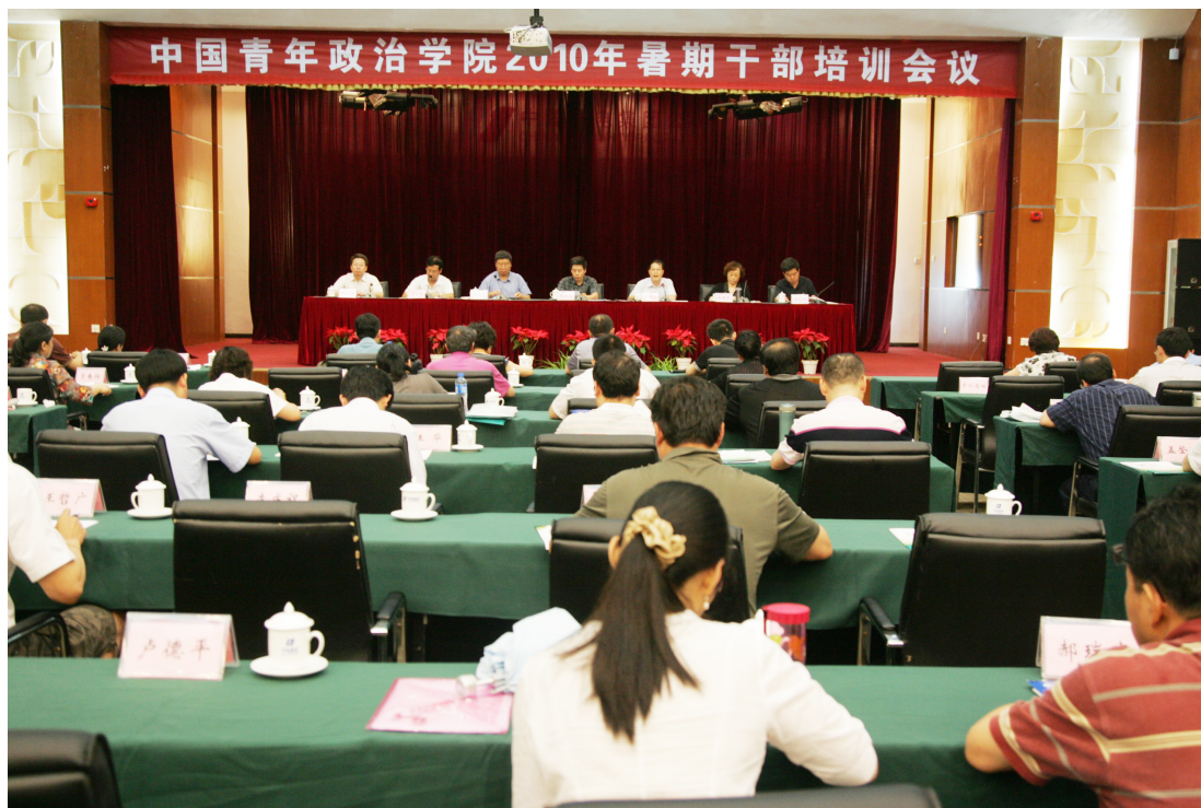
7月14日至16日，我校召开主题为“学习教育发展纲要，共谋学校发展大计，加强干部队伍建设，提高内部管理效率”的2010年暑期干部培训会议。