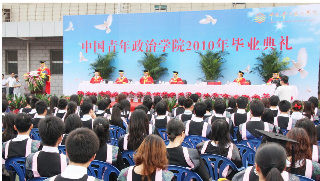
6月28日，我校举行2010年毕业典礼。