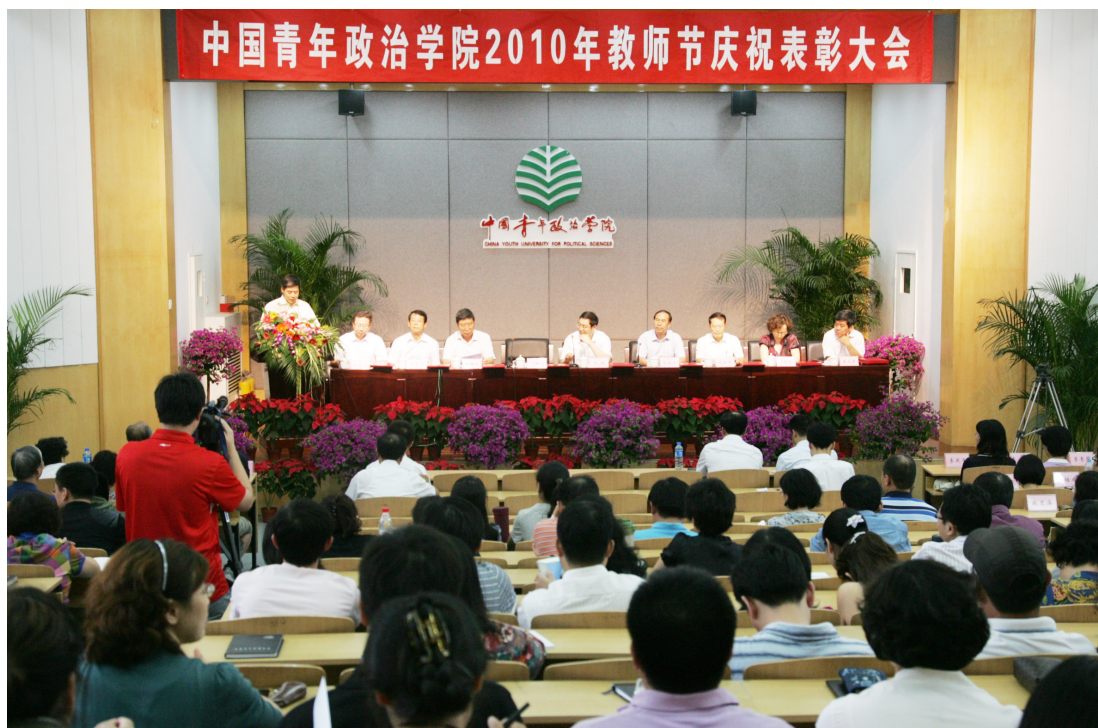
9月10日，我校召开教师节庆祝表彰大会。团中央书记处常务书记王晓、中直机关事务管理局副局长张放鸣出席大会并向获奖同志颁奖。