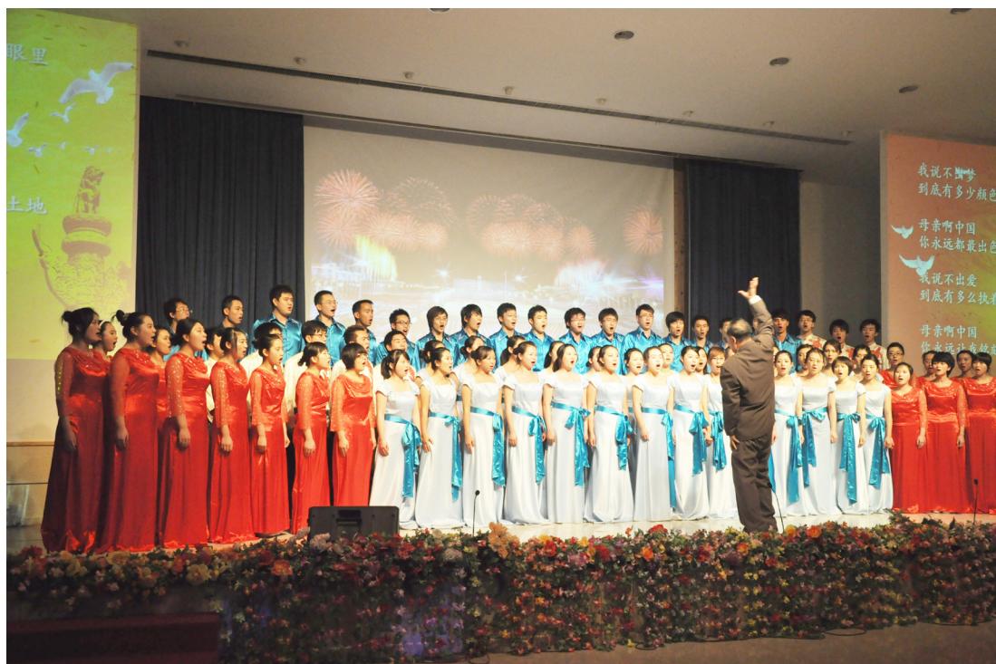
12月9日，我校团委、艺术团、学生会举办“艺动青春，扬帆未来”迎新春晚会。