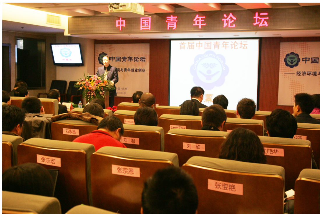
11月20日，由我校主办的首届中国青年论坛在我校举行。